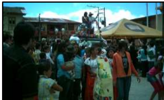
Fotografía 1. Celebración del día del campesino en el municipio de Herveo (Tolima)

De acuerdo al EOT de Herveo, 2005, las celebraciones de mayor importancia en el municipio son: la Fiesta del campesino que se celebra del 12 al 15 junio, las fiestas del retorno que se celebran en el mes de octubre donde se presentan jornadas culturales, desfiles de comparsas y alboradas; y la feria ganadera y comercial que se lleva a cabo en diciembre. El 16 de Julio se celebra el principal certamen religioso en honor a la Virgen del Carmen. Este documento también menciona las ferias y fiestas en Padua que tienen lugar el mes de septiembre con el festival equino, la feria ganadera, las riñas de gallos, las corraléjas, las casetas y reinados populares. Igualmente se celebran actividades culturales correspondientes al día del Idioma, Fiestas Nacionales como el 20 de julio y 7 de agosto acompañados por la banda marcial de la Institución Educativa Marco Fidel Suárez. (Alcaldía Municipio Herveo-Tolima, EOT, 2005).