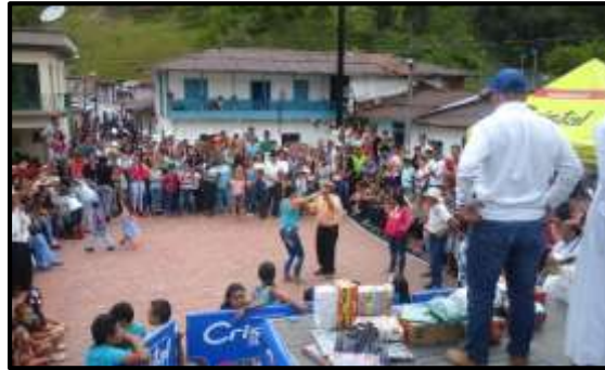
Fotografía 2. Celebración del día del campesino en el municipio de Marulanda (Caldas).

homenaje a la cultura agropecuaria local que incluye reinado veredal, verbenas populares, competencias deportivas, cabalgatas y concursos de arrieros. El principal evento religioso es la fiesta patronal de la Virgen de las Mercedes.