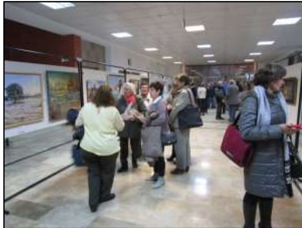
Fotografía 3. Centro cultural del Municipio de Manzanares.